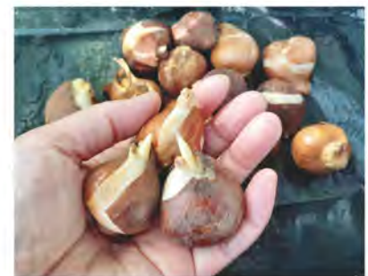
チューリップの球根。

フローランテ宮崎では「花と緑の講座」を実施中!ご希望の方はホームページからお申し込みください。