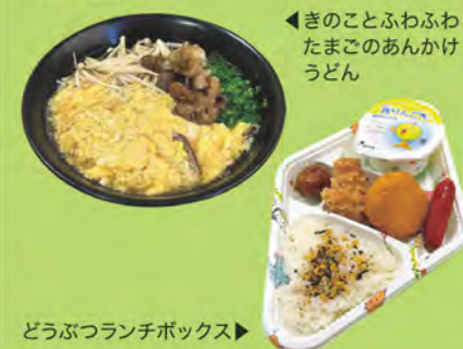
◀きのこふわふわ たまごのあんかけ うどん

これからの季節に嬉しい、あったかいどん の種類が増えました。また、お子様に大人 気! ガチャガチャ付きの「どうぶつランチ ボックス」もリニューアルしました。定番メ ニューのほかにも、期間限定メニューを予定 しています。