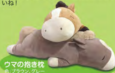
ウマの抱き枕 色:ブラウン、グレー

ショップに2026年の干支「ウマ」の抱き枕 が入荷しました!と〜っても手触りの良い抱 き枕です。他にも、ウマのグッズを多数入荷 予定です。お気に入りの子を見つけてくださ いね!